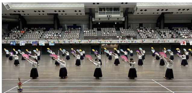
高校3年生「荒城の月」

生徒たちの姿に心打たれる体育祭は、卒業生はどなたでも入場可能です。おひとりさまでも、ご友人とでも、おひさまと一緒にでも、いつでもお越しください。一緒に声援を送りませんか。