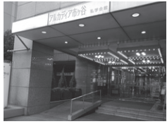
①アルカディア市ヶ谷